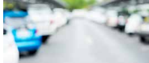
Parking Sneppenbos grondig aanpassen p. 3