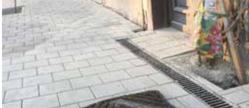
Werken A. Franckstraat: veel blunders p. 2