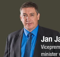
Jan Jambon Vicepremier, minister van Veiligheid en Binnenlandse Zaken