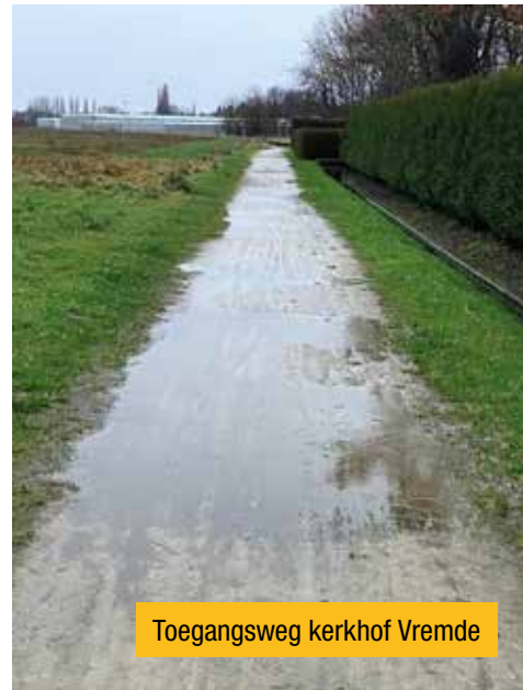
Toegangsweg kerkhof Vremde