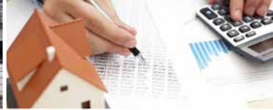
Gemeente houdt totale uitverkoop (p. 3)